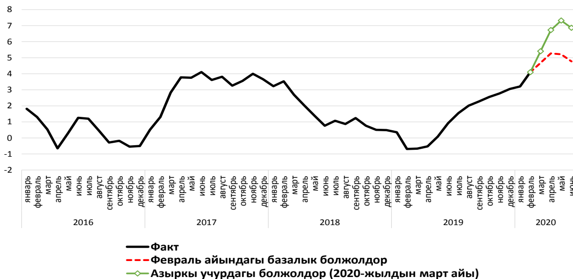
2-график. Кыргыз Республикасынын аймактары боюнча инфляция (%, өткөн жылдын тиешелүү айына карата ай ичинде)