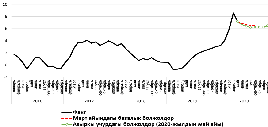
2-график. Кыргыз Республикасынын аймактары боюнча инфляция (%, өткөн жылдын тиешелүү айына карата ай ичинде)